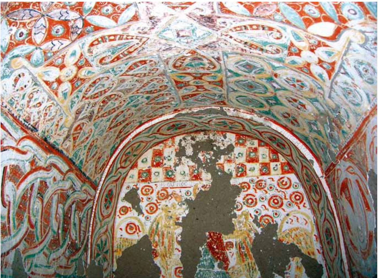
5. Zapadni travej, Ağa Altı, Kapadokija West bay, The Ağa Altı Kilise, Cappadocia