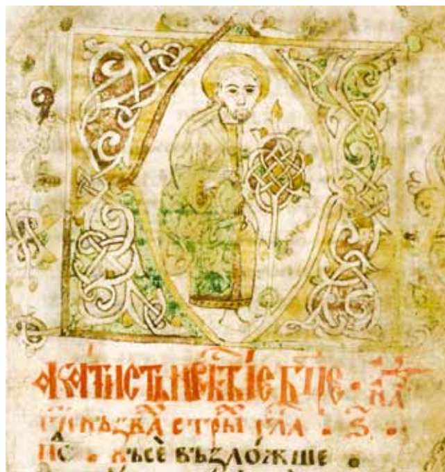
12. Mojsije pred gorućim grmom, Akatistnik, Matica srpska PP I 16, f. 4

Pitanje smisla glosa i marginalnih bilježaka zahtijeva puno više pažnje i posebnu analizu. Vraćajući se zato temi rasprave, treba istaknuti da u sačuvanoj građi, u kojoj još ima nedovoljno ispitanih spomenika, postoji više analogijâ za zaglavlje iz Hvalova rukopisa, a bliske se nalaze i u Mletačkom zborniku. 87 Iako i u nekim novijim radovima istraživači teže u geometrijskom ukrasu vidjeti samo funkcionalna, pomoćna sredstva, namijenjena korisnicima rukopisa, 88 građa jasno pokazuje da je ukras nosio vrlo određeno značenje. O simbolizmu ikonografskog jezika svjedoče i raskošne minijature u sinajskim Homilijama Grgura Nazijanskog (Cod. gr. 339), kao i vatikanskom i pariškom primjerku Homilija Jakova Kokinobafskog (Vat. gr. 1162; Par. gr. 1208), gdje arhitektonski okvir nije prikaz realne građevine, već zamišljene stvarnosti Nebeskog Jeruzalema. 89 O tome najbolje svjedoče i tzv. „arhitektonske“ zastavice u obliku crkava s kupolama, u rukopisima kakvi su Psaltir Branka Mladenovića (Panaitesku 205, fol. 1v, 4v), Triod Georgija Anagnosta (Arhiv HAZU III b 18, fol. 1) ili dečanski Parenesis (Arhiv SANU br. 60, fol. 2). 90 Natpisi uz te zastavice, u kojima se traži pomoć od Boga ili se navodi citat: „Premudrost sazida sebi hram“, dokaz su aktivna odnosa iluminatora prema izgledu zaglavlja. Cvjetnom motivu često je pridavano značenje Božje nazočnosti u gorućem grmu, iz kojega Mojsije čuje riječ