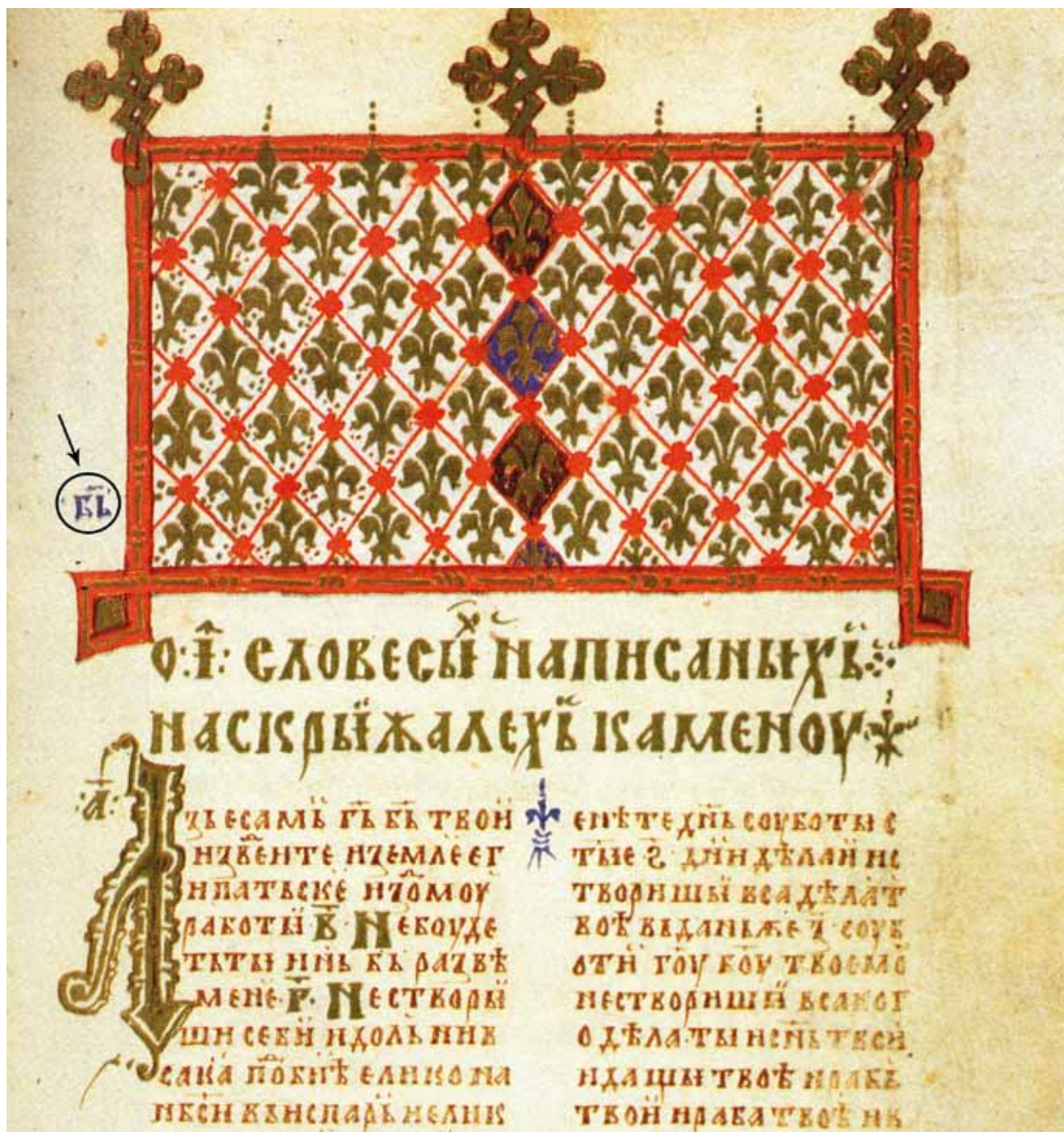
1. Zaglavlje Dekaloga, Hvalov zbornik, Bologna Ms. 3575 B, f. 151 Header to the Ten Commandments, The Hval Codex , Bologna Ms. 3575 B, fol. 151

bosanski i herceg splitski), kao i o pisaru (krstjanin Hval), koji je vjerovatno bio jedan od iluminatora. Zato je prije gotovo tri desetljeća skupina jugoslavenskih autora poduzela izdavanje faksimila s prijepisom i pratećim esejima, približivši ga stručnoj i široj javnosti. 7 Rukopis je često bio istraživan u cilju utvrđivanja podrijetla likovnih