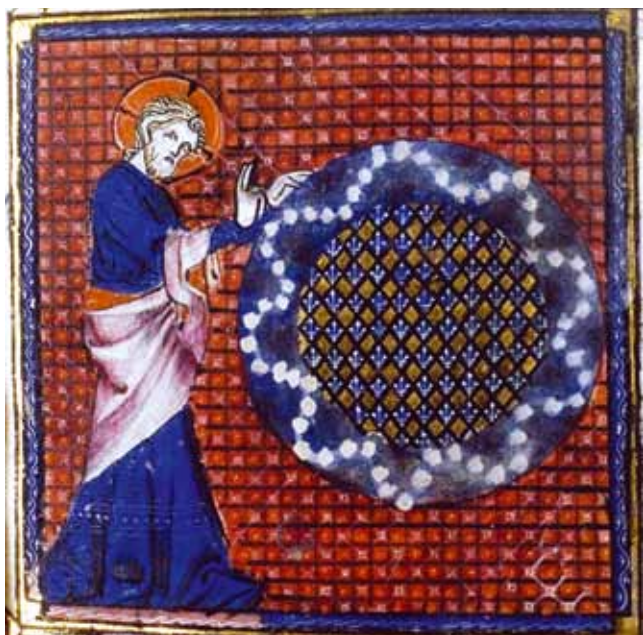
8. Stvaranje svijeta , BNF Ms. Richelieu fr. 8, f. 62v

Creation of the World , BNF Ms. Richelieu fr. 8, fol. 62v