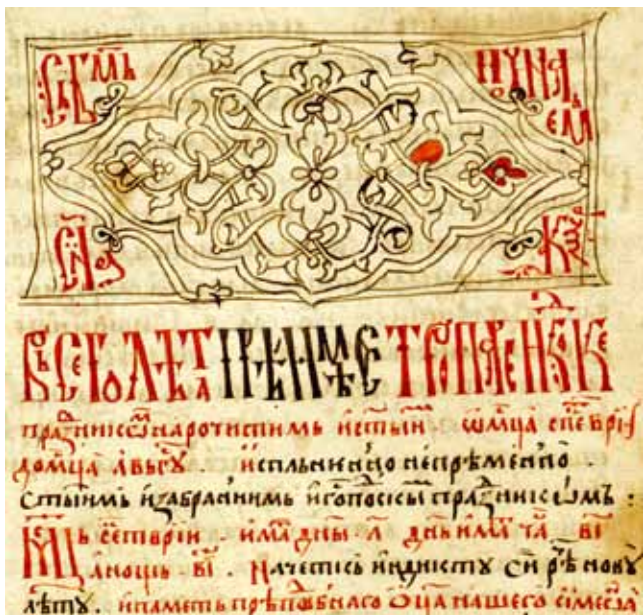
11. Zaglavlje sinaksara, Psalter s posledovanjem , HBC бр. 30, f. 125

Posebno je pitanje marginalnih bilježaka u Hvalovu zborniku u kojima se herceg spominje kao uram Hrvoje. Oдавno je utvrđeno da je visoka titula uram, odnosno urum, ugarskog podrijetla, i da je tu u funkciji osobita položaja hercega Hrvoja kao namjesnika Ladislava Napuljskog. 82 Iako bilješke, izvedene zlatom i posebno obrubljene ljiljanima,