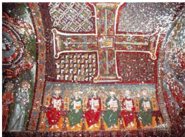
6. Svod, Kokar kilise, Kapadokija Vault, The Kokar Kilise, Cappadocia

Ipak, cvjetni motivi kao simboli rajskih naselja nisu bili jedini koji su u umjetnosti srednjeg vijeka korišteni za prikazivanje svetosti i/ili prisutnosti božanstva. U tom su smislu od posebna značaja rezultati istraživanja judeokršćanskih paradigmi H. Kesslera, a prije svega zastora starozavjetnog Šatora, koja čvrsto ističu bitnu vezu ukrasa i sakralnog. 31 Istražena građa pokazuje da je jedan od motiva imao najširu primjenu: riječ je upravo o mrežastu romboidnom polju s cvjetovima čije je podrijetlo u načinu na koji je prikazivan zastor tabernakula, tj. izgledu Šatora svjedočanstva, kao