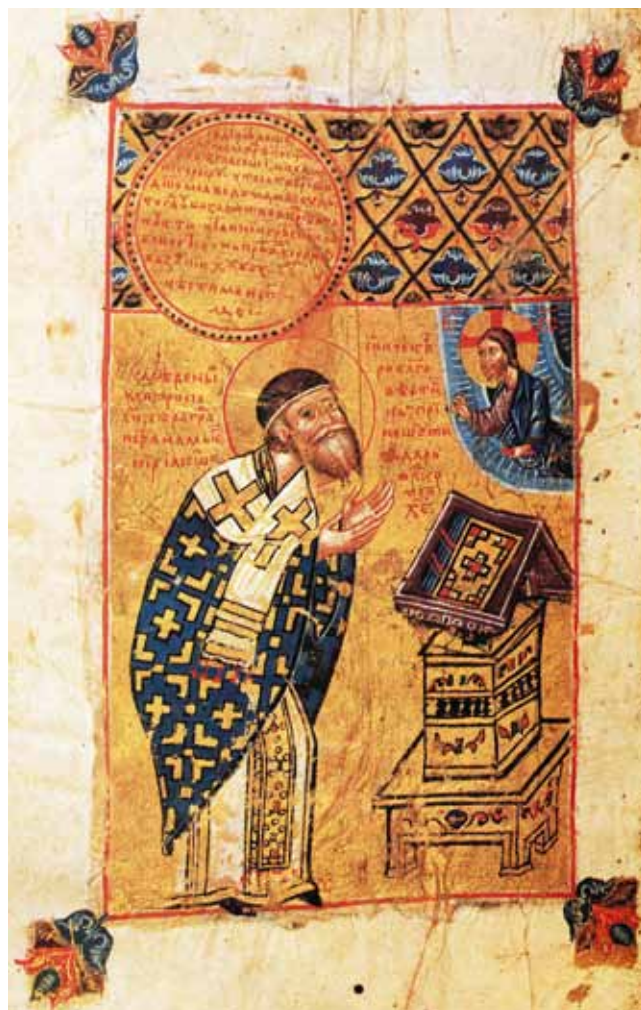
9. Metropolit Jakov, Četveroevanđelje serskog mitropolita Jakova , BL Add. 39626, f. 292v (izvor: JOVANKA MAKSIMOVIĆ /bilj. 8/, T. 18) Metropolitan Jakob, The Gospels of Jakob of Serres , BL Add. 39626, f. 292v

Čini se da u zapadnoeuropskoj historiografiji prevladava uvjerenje da pojava mreže s ljiljanima isključivo označava kraljevsku vlast i tumači se u nacionalnim kategorijama, jer se do simbola ljiljana ( fleur-de-lis ) dolazi