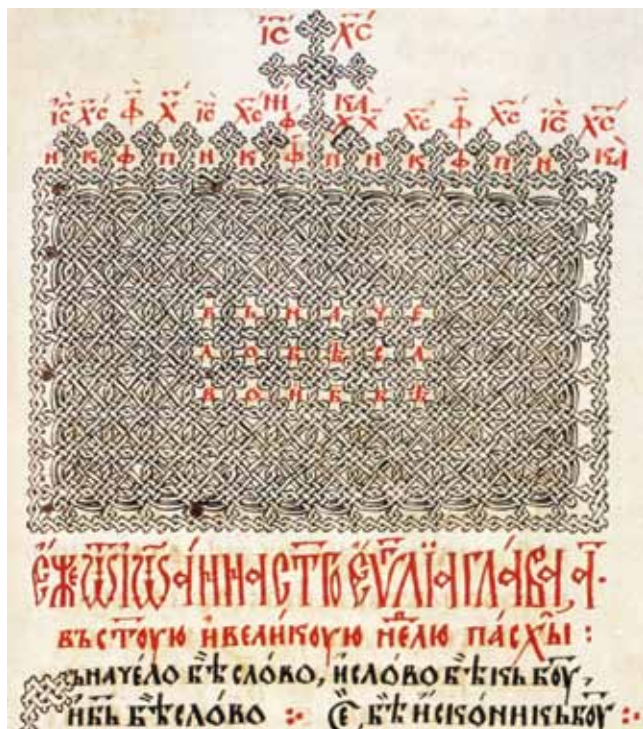
10. Zaglavlje Evangelja po Ivanu , Hilendarsko četvoroevangelje, Хил. 4, f. 200

Header of the Gospel of John, The Chilandar Gospels , Хил. 4, fol. 200