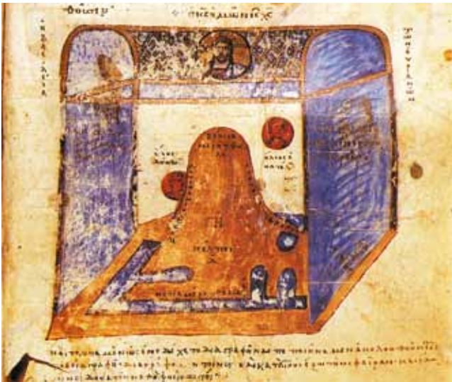
4. Nebesko carstvo , Kršćanska topografija, Sinai cod. 1186, f. 69 Kingdom of Heaven, The Christian Topography , Sinai cod. 1186, fol. 69

Smisao je marginalne bilješke uz zaglavlje Dekaloga u Hvalovu zborniku, bez sumnje, dopuniti zastavicu ispred teksta s Gospodnjim riječima izrečenim Mojsiju na Sinajskoj gori. O važnosti Dekaloga u iluminaciji bosanskih rukopisa svjedoči i zaglavlje Mletačkog zbornika koje je izvedeno u obliku narativne scene teofanije, s Mojsijem ispred goruće kupine, figurama Boga Oca i Krista s tetramorfom, pri čemu je u njen okvir unesen i natpis koji pojašnjava prikaz. 20 Posebnu studiju posvećenu ikonografiji scene objavila je nedavno E. Mazrak, koja je uspjela u cjelini pročitati natpis. 21 Tekstualni ključevi uz zaglavlja Hvalova i Mletačkog zbornika slični su onima u rukopisu Dobrejšova evanđelja, gdje sve minijature imaju glose što pojašnjavaju ne samo scene i figure već i druge detalje. 22 Od posebna značaja je zastavica pred sinaksarom u ovome bugarskom rukopisu, jer je označena opsežnim natpisom: СЕ КСТЪ РАН НЖЕ НАРНЦАЕТ СМ ПАРАДНЕСЪ (sl. 3). 23 Čine je prepleteni krugovi sa srcolikim cvjetnim