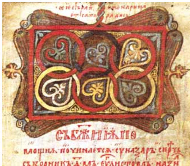
3. Zaglavlje sinaksara, Dobrejšovo evanđelje, HBKM 17, f. 121

Synaxarion header, The Dobrejšo's Gospels, HBKM 17, fol. 121