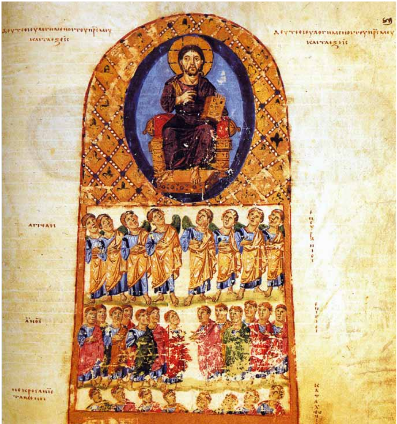
7. Nebesko carstvo , Kršćanska topografija, Vat. cod. gr. 699, f. 89 Kingdom of Heaven, The Christian Topography , Vat. cod. gr. 699, fol. 89

Izvanredan značaj Hvalova zaglavlja Dekaloga jest upravo u tome što se nalazi pred biblijskim tekstom koji svjedoči o tradiciji prenošenja Mojsijeve uloge u podizanju hrama Božjeg po Gospodnjem nalogu,